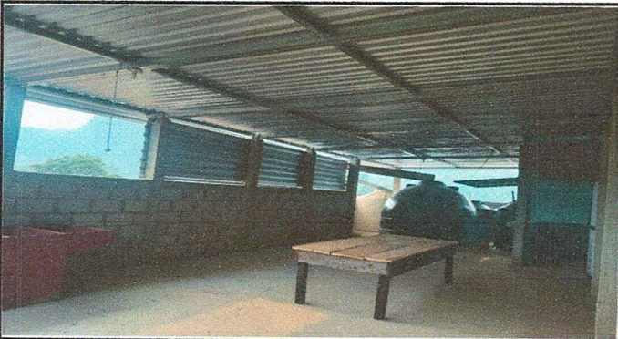
Foto 3: Panorámica de área de cocina ya rehabilitada. Instalación de tubería agua fluvial, cambio de depósito de agua, cambio de piso de concreto.