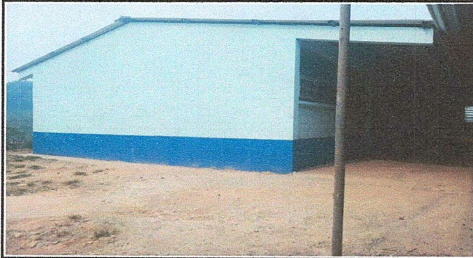
Foto1: Panorámica modulo I (trabajos finalizados).