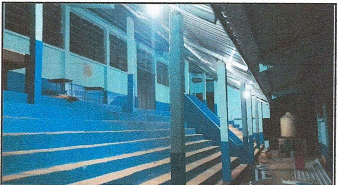
Foto 4: Aplicación de pintura paredes en ambientes del nivel primaria.